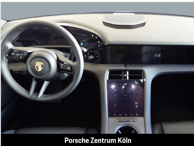
Porsche Zentrum Köln