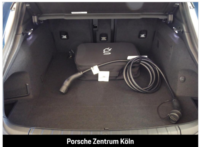
Porsche Zentrum Köln