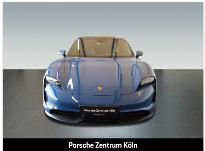
Porsche Zentrum Köln