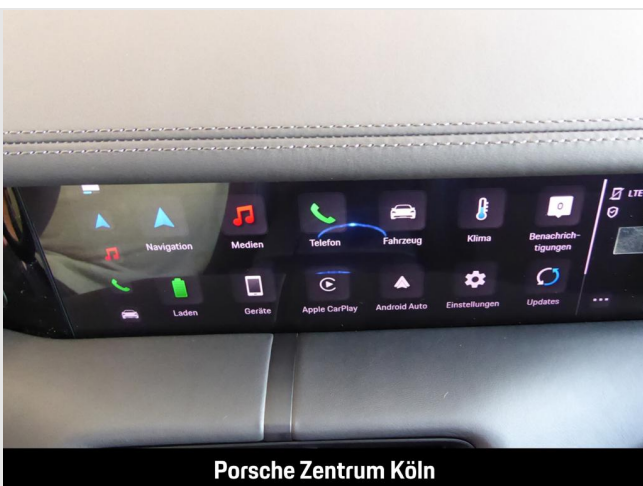
Porsche Zentrum Köln