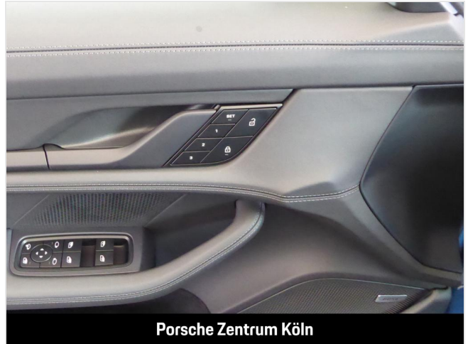
Porsche Zentrum Köln