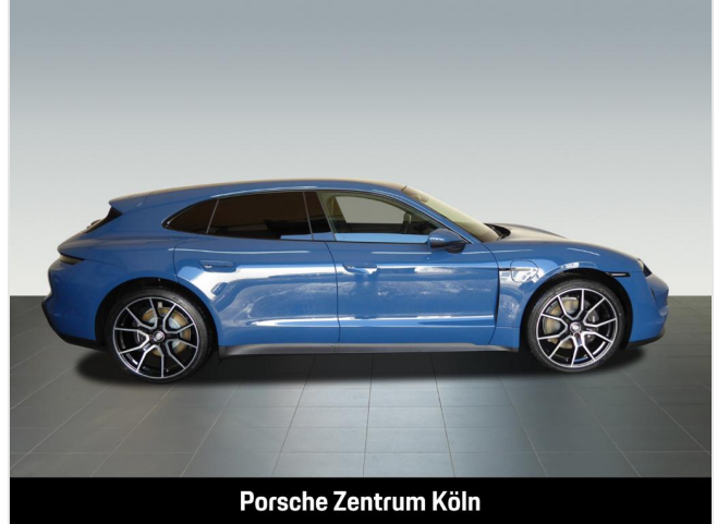
Porsche Zentrum Köln