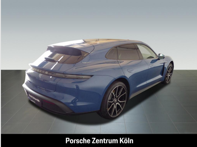
Porsche Zentrum Köln

Angebotsnummer: A69063 Ausdruck vom: 29.04.2024