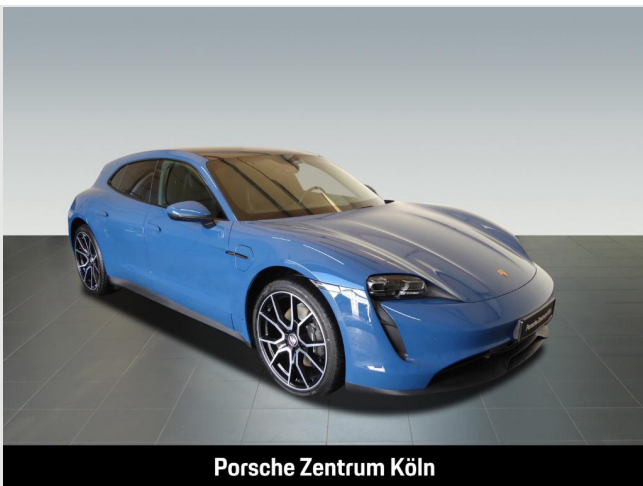
Porsche Zentrum Köln