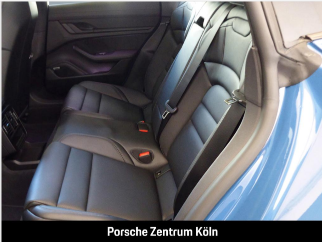
Porsche Zentrum Köln

Angebotsnummer: A69063 Ausdruck vom: 29.04.2024