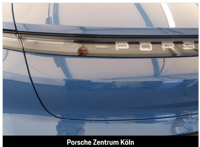
Porsche Zentrum Köln