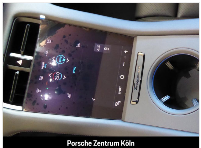
Porsche Zentrum Köln