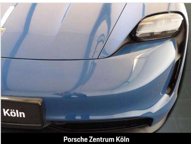
Porsche Zentrum Köln