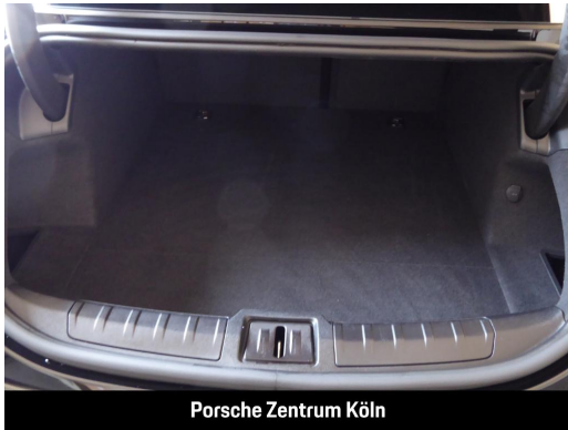
Porsche Zentrum Köln