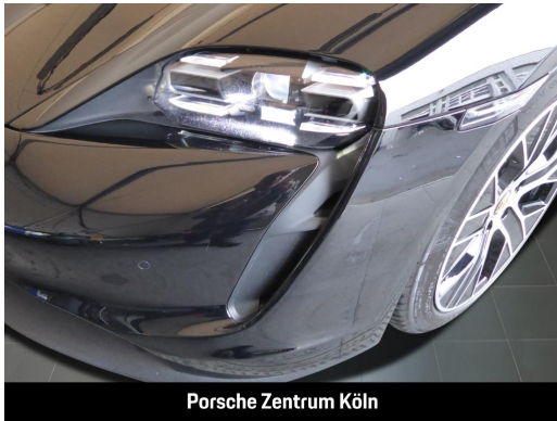
Porsche Zentrum Köln