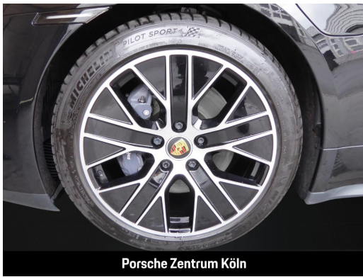
Porsche Zentrum Köln