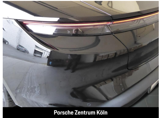
Porsche Zentrum Köln