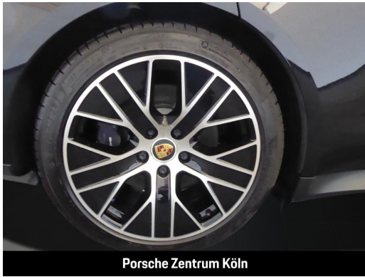
Porsche Zentrum Köln