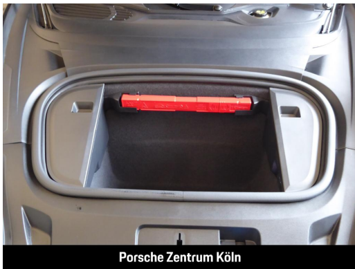
Porsche Zentrum Köln