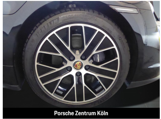
Porsche Zentrum Köln