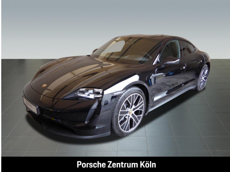
Porsche Zentrum Köln